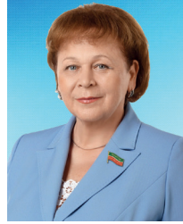
РАТНИКОВА Римма Атласовна Председатель Комиссии Государственного Совета Республики Татарстан по установлению идентичности текстов законов на татарском и русском языках