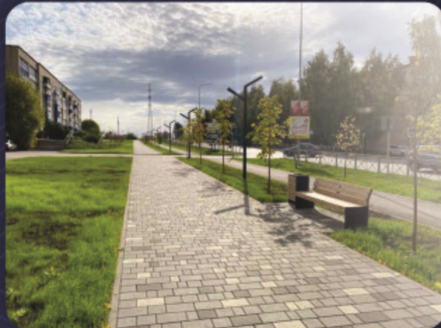
Кластер комфортной городской среды