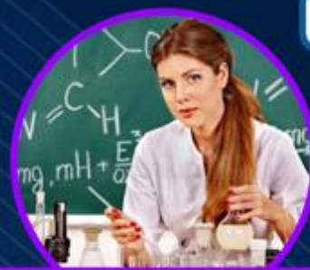
МЕНДЕЛЕЕВСКИЙ ХИМИКО- ТЕХНОЛОГИЧЕСКИЙ КОЛЛЕДЖ