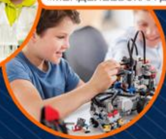
ЦЕНТР ДЕТСКИХ КОМПЕТЕНЦИЙ «МЕНДЕЛЕЕВСКАЯ ДОЛИНА»