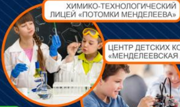
ХИМИКО-ТЕХНОЛОГИЧЕСКИЙ ЛИЦЕЙ «ПОТОМКИ МЕНДЕЛЕЕВА»