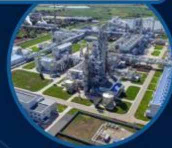
ПЕРЕДОВАЯ ИНЖЕНЕРНАЯ ШКОЛА «ПРОМХИМТЕХ»