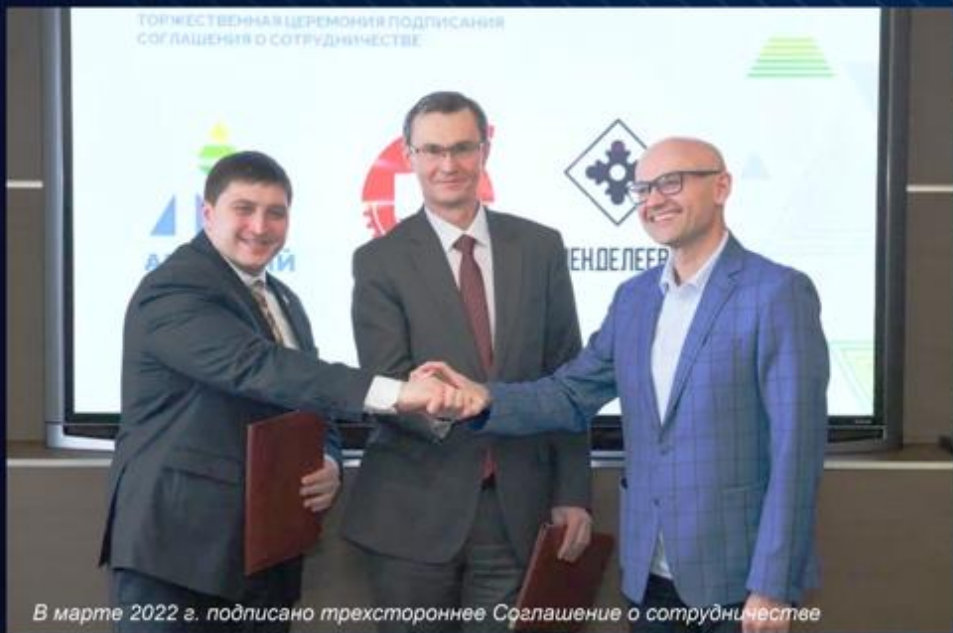
ТОРЖЕСТВЕННАЯ ЦЕРЕМОНИЯ ПОДПИСАНИЯ СОГЛАШЕНИЯ О СОТРУДНИЧЕСТВЕ