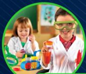
ХИМИЧЕСКИЙ ДЕТСКИЙ САД «АКАДЕМИЯ ДЕТСТВА»