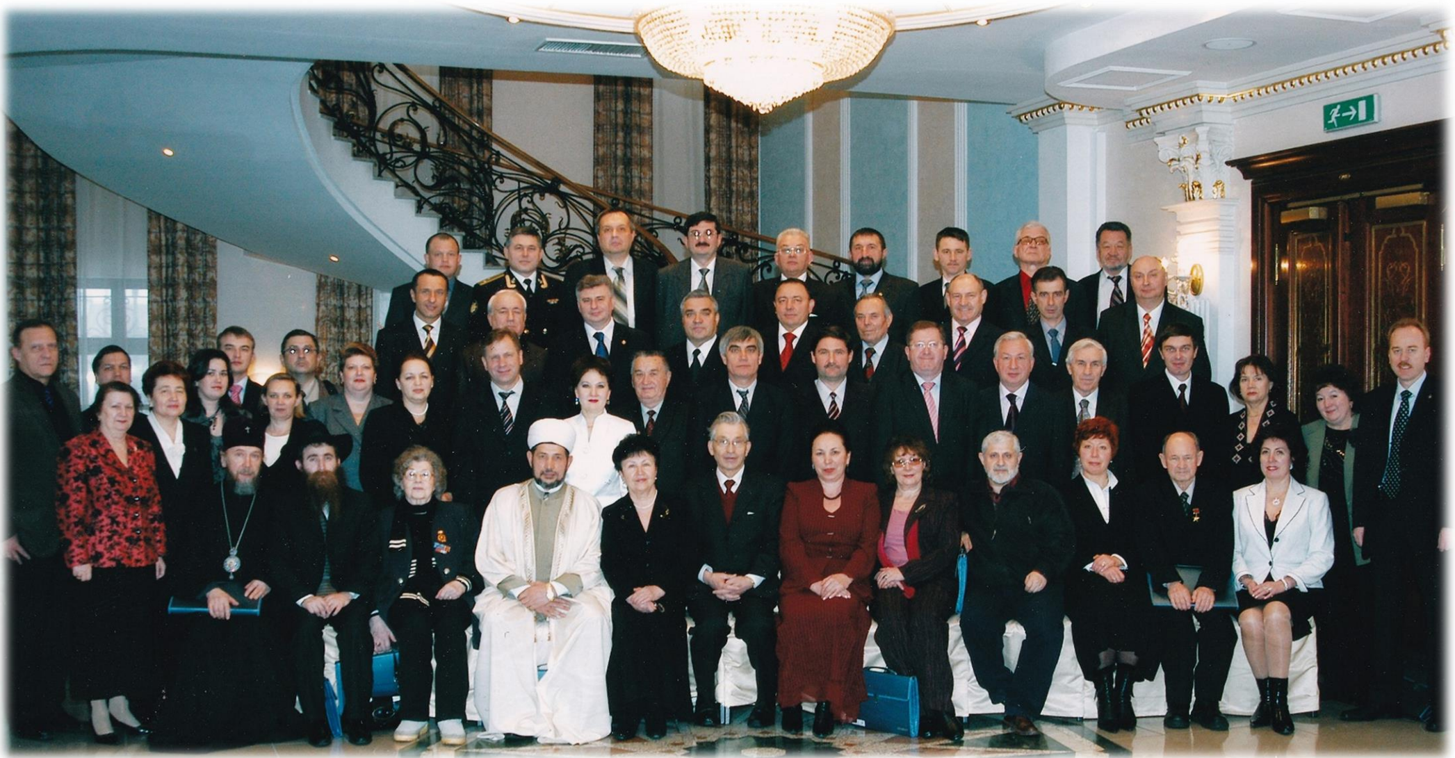
Первый состав Общественной палаты Республики Татарстан