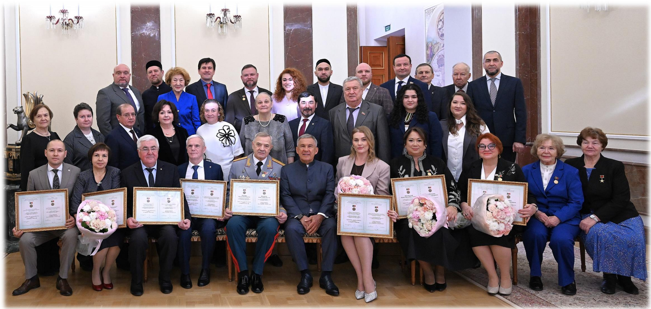
Лауреаты премии Раиса Республики Татарстан за вклад в развитие институтов гражданского общества в 2025 году