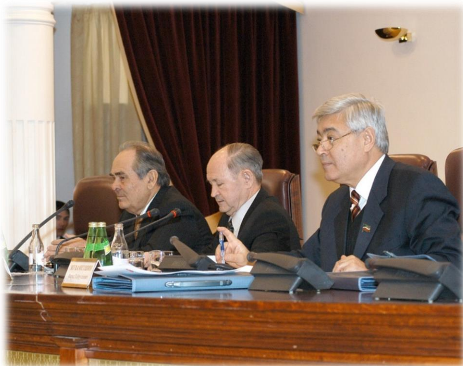
Первое заседание Общественной палаты РТ 27 января 2006 г.

«Общественная палата должна стать "катализатором" социально значимых инициатив, идущих от самого общества.