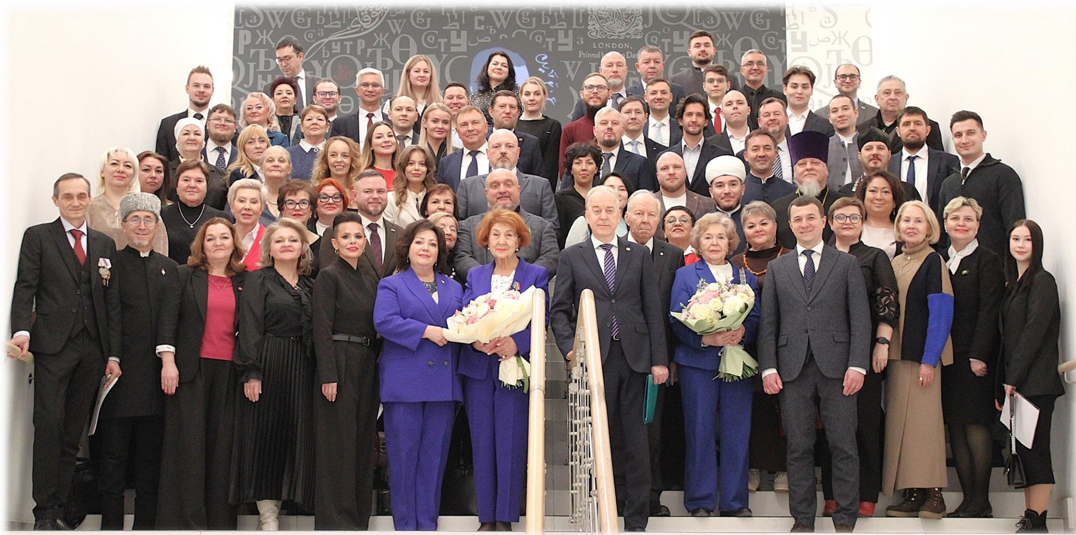
Общественная палата Республики Татарстан восьмого состава